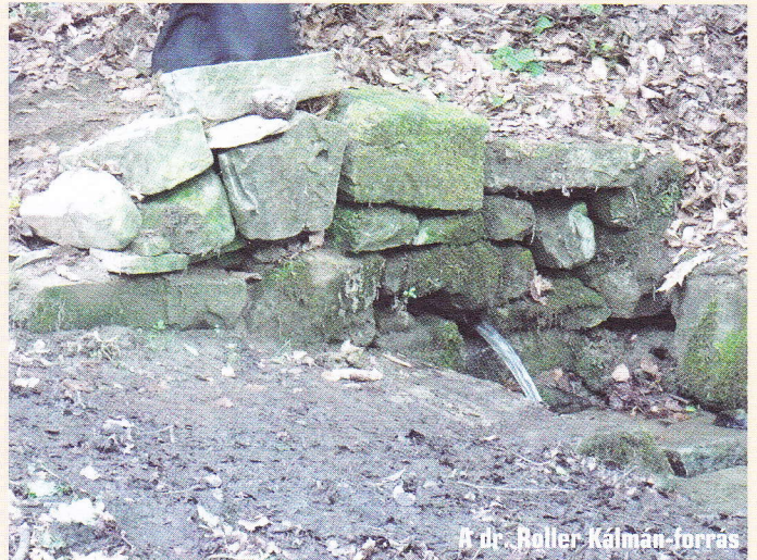
A dr. Roller Kálmán forrás