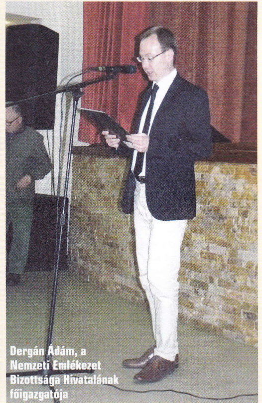
Dergán Ádám, a Nemzeti Emlékezet Bizottsága Hivatalának főigazgatója